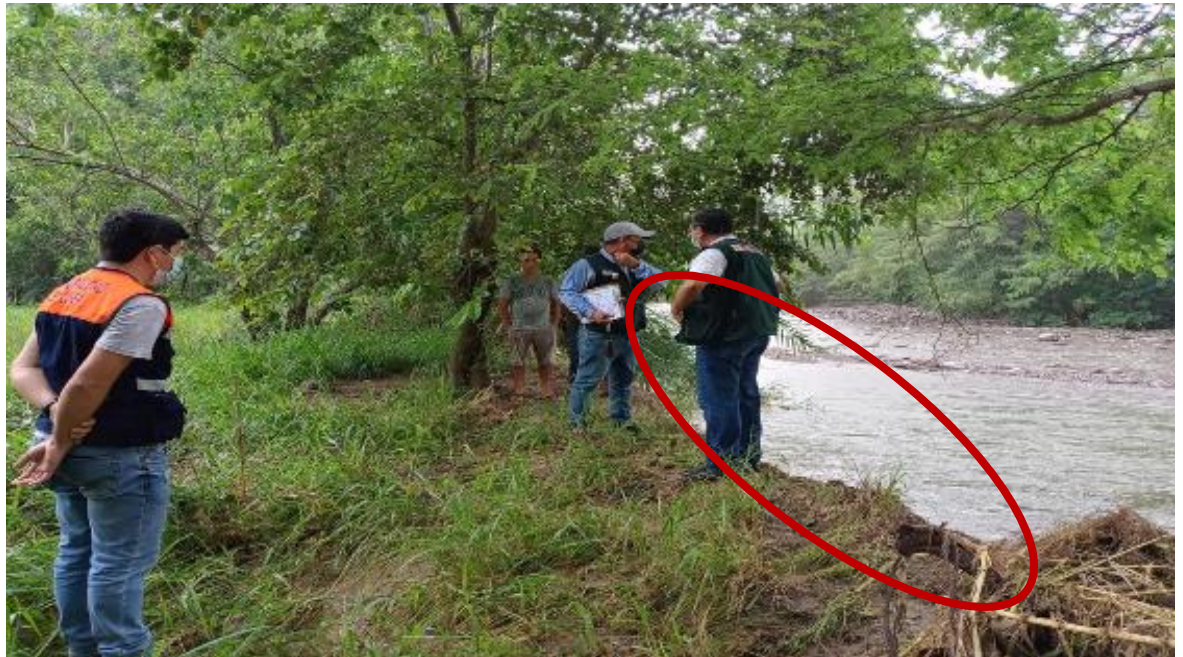
FOTOGRAFIA N°02: ZONA A PROTEGER EN LA MARGEN DERECHA DE LA QUEBRADA LIMONES