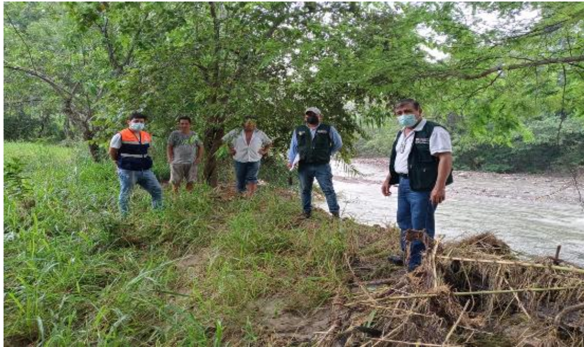
FOTOGRAFIA N°01: AFECTACION DE EN LA CRECIDA Y DESBORDE DE LA QUEBRADA LIMONES EN LA MARGEN DERECHA